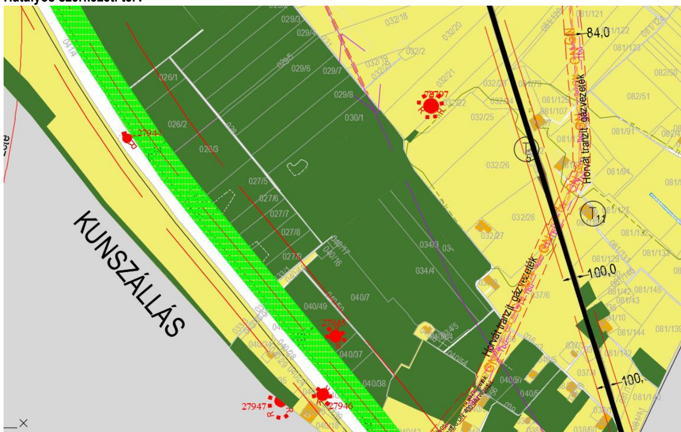
Tervezett szerkezeti terv